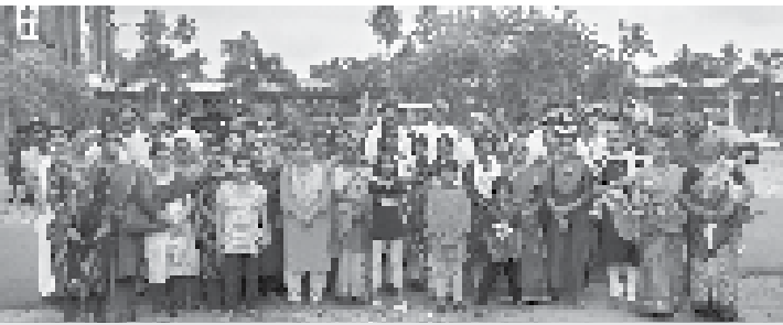
കത്തോലിക്ക കോൺഗ്രസിന്റെ നേതൃത്വത്തിൽ 14 പള്ളികളിലേക്ക് നടത്തിയ നോമ്പുകാല തീർത്ഥ യാത്രയിൽ പങ്കെടുത്തവർ.

അയ്യന്തോൾ ഇടവക കത്തോലിക്ക കോൺഗ്രസിന്റെ നേതൃത്വത്തിൽ 14 പള്ളികളിലേക്ക് 27.3.22 ഞായറാഴ്ച ഭക്തി നിർഭരമായ നോമ്പുകാല തീർത്ഥയാത്ര നടത്തി.