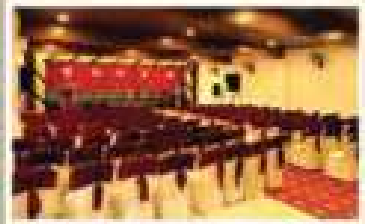
RUBY, 1 ST FLOOR A/C HALL