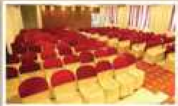
COREL, 2 ND FLOOR NON A/C HALL

വിവാഹം, വിവാഹ വിരമം, പാർട്ടികൾ, ബാപ്റ്റിസം ബാപ്റ്റിസം, ബാപ്റ്റിസം, ക്രൈസ്തവ വിദ്യാഭ്യാസം മുതൽ എല്ലാവിധ ക്രൈസ്തവ പരിപാടികൾക്കും ഇവിടെ സൗകര്യം നൽകുന്നു.