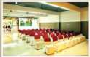
PEARL, GROUND FLOOR NON A/C HALL