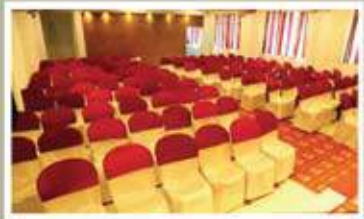
COREL, 2 nd FLOOR NON A/C HALL

വിവാഹം, വിവാഹ നിശ്ചയം, വാർഷികം, ജന്മദിനം മാജോദീസ, സെമിനാറുകൾ, കമ്പനി മീറ്റിങ്ങുകൾ എന്നീ പരിപാടികൾക്ക് ഹാൾ വാടകക്ക് തൽക്കൂട്ടം.