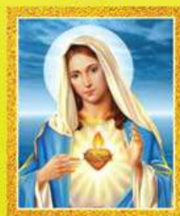
അഡ്വ. ജോസ് ഡേവിസ്