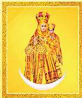
ജുവീറ്റർ & ഫാബിലി