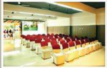
PEARL, GROUND FLOOR NON A/C HALL