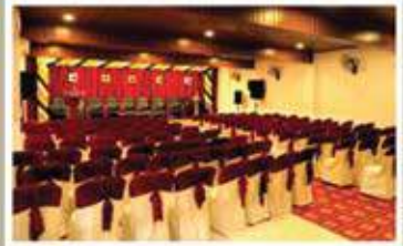
RUBY, 1 st FLOOR A/C HALL