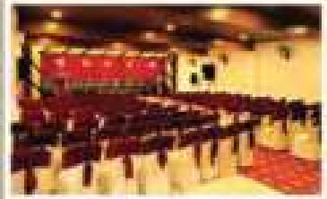
RUBY, 1 ST FLOOR A/C HALL