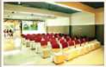
PEARL, GROUND FLOOR NON A/C HALL