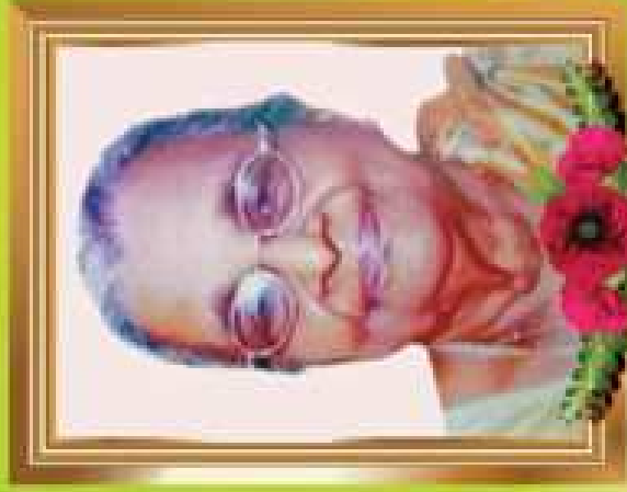
പരമേശ്വരൻ മര്യപ്രഭാണന്തൻ വര്യതുമുണ്ണി മര്യൻ