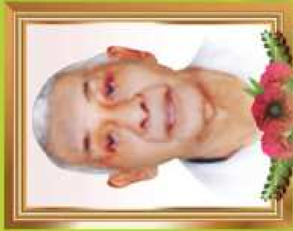
പരമേശ്വരൻ മര്യപ്രഭാണന്തൻ അന്തരജൻ മര്യൻ