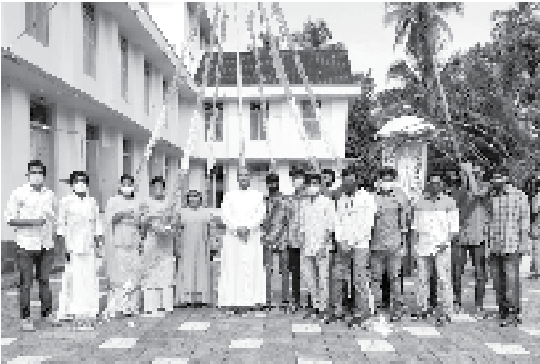
സ്വതന്ത്രദിനാഘോഷത്തിന്റെ ഭാഗമായി അയ്യന്തോൾ സി.എൽ.സി അംഗങ്ങൾ ഗ്രോട്ടോയിൽ ദേശീയ പതാക ഉയർത്തുന്നതിന് നേതൃത്വം നൽകി