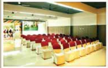
PEARL, GROUND FLOOR NON A/C HALL