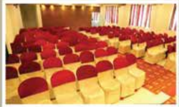
COREL, 2 nd FLOOR NON A/C HALL

വിവാഹം, വിവാഹ നിശ്ചയം, വാർഷികം, ജന്മദിനം മാജോദിസ, സെമിനാറുകൾ, കമ്പനി മീറ്റിങ്ങുകൾ എന്തി വരിപാടികൾക്ക് ഹാൾ വാടകക്ക് നൽകുന്നു.