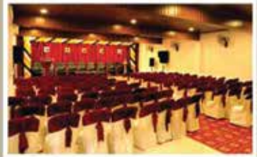
RUBY, 1 st FLOOR A/C HALL