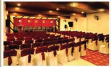
RUBY, 1 st FLOOR A/C HALL