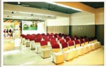
PEARL, GROUND FLOOR NON A/C HALL