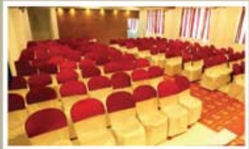
COREL, 2 nd FLOOR NON A/C HALL

വിവാഹം, വിവാഹ നിശ്ചയം, വാർഷികം, ജന്മദിനം മാമ്മോദിസ, സെമിനാറുകൾ, കമ്പനി മീറ്റിങ്ങുകൾ എന്നീ പരിപാടികൾക്ക് ഹാൾ വാടകക്ക് തൽക്കുന്നു.