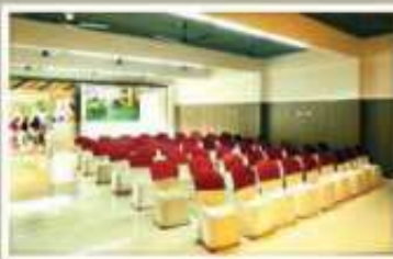
PEARL, GROUND FLOOR NON A/C HALL