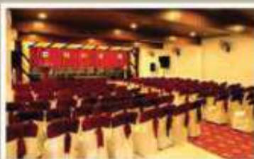
RUBY, 1 st FLOOR A/C HALL