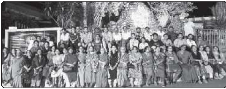
ലോകത്തിൽ ആദ്യമായി മാതാവ് പ്രത്യക്ഷപ്പെട്ട കുറവിലങ്ങാട് മാർത്ത മറിയം പള്ളി സന്ദർശിച്ചപ്പോൾ കുടുംബകൂട്ടായ്മ കേന്ദ്രസമിതി സെക്രട്ടറി