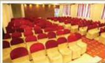
COREL, 2 nd FLOOR NON A/C HALL

വിവാഹം, വിവാഹ നിശ്ചയം, വാർഷികം, അന്തിമം മാജന്റാ, സെമിനാറുകൾ, കമ്പനി യോഗങ്ങൾ എന്നീ പരിപാടികൾക്ക് ഹാൾ വാടകയ്ക്ക് നൽകുന്നു.