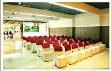
PEARL, GROUND FLOOR NON A/C HALL