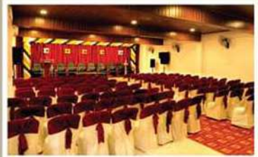
RUBY, 1 st FLOOR A/C HALL