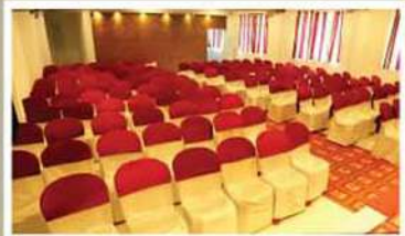
COREL, 2 nd FLOOR NON A/C HALL

വിവാഹം, വിവാഹ നിശ്ചയം, വാർഷികം, ജന്മദിനം മാജ്ജാദീസ, സെമിനാറുകൾ, കമ്പനി മീറ്റിങ്ങുകൾ എന്നീ പരിപാടികൾക്ക് ഹാൾ വാടകക്ക് തൽകൗതുകം.