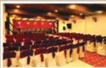
RUBY, 1 st FLOOR A/C HALL