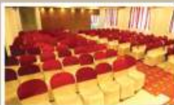
COREL, 2 nd FLOOR NON A/C HALL

വിവാഹം, വിവാഹ നിശ്ചയം, വാർഷികം, ഭരണദിനം മാജോലീസ, സെമിനാറുകൾ, കമ്പനി ബിറ്റിങ്ങുകൾ എന്നീ പരിപാടികൾക്ക് ഹാൾ വാടകയ്ക്ക് തൽക്കൂട്ടം.