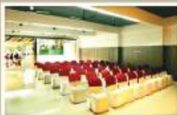
PEARL, GROUND FLOOR NON A/C HALL