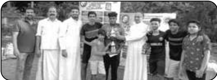
ഷൂട്ടൗട്ട് മത്സരത്തിൽ ഒന്നാം സ്ഥാനം നേടിയ ഹോളി ഫാമിലി യൂണിറ്റ്