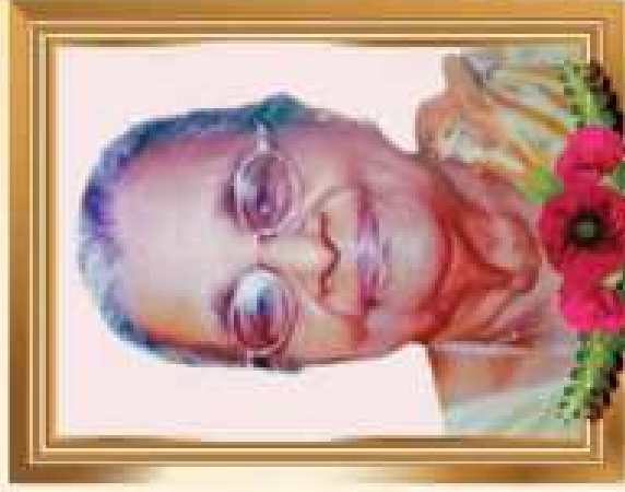
പാലക്കാട്ടിൽ മാധ്രണത്ത് വറുതുണ്ണി മാള