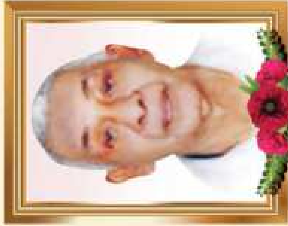
പാലക്കാട്ടിൽ മാധ്രണത്ത് അനന്തൻ മകൻ