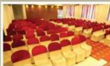
COREL, 2 nd FLOOR NON A/C HALL

വിവാഹം, വിവാഹ നിശ്ചയം, വാർഷികം, ഓന്മിതം മാജന്മാലിസ, സെമിനാറുകൾ, കമ്പനി ബിറ്റിങ്ങുകൾ എസീ പരിപാടികൾക്ക് ഹാൾ വാടകക്ക് നൽകുന്നു.