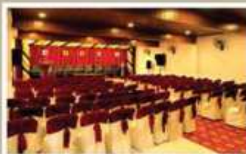
RUBY, 1 st FLOOR A/C HALL