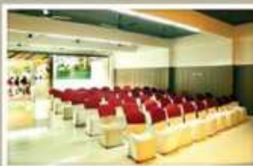
PEARL, GROUND FLOOR NON A/C HALL