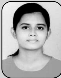
Jismi A.F FULL A + PLUS II