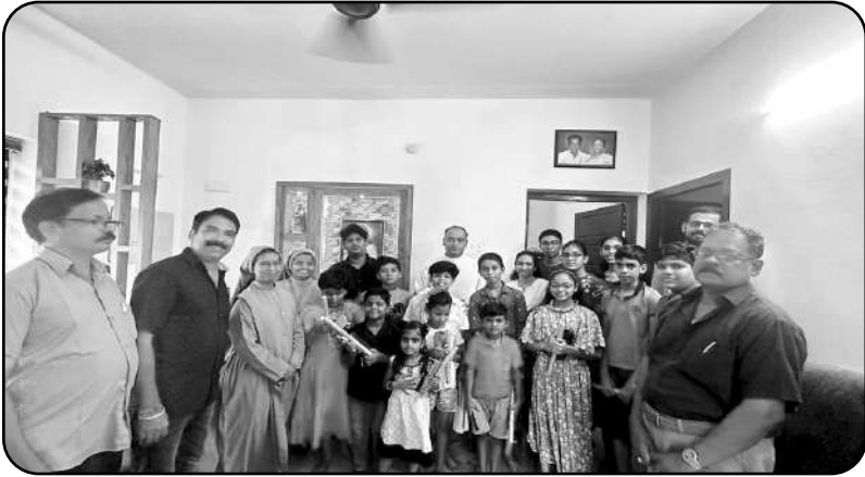
ലിറ്റിൽഫ്ലവർകുടുംബകൂട്ടായ്മയിലെ കുട്ടികൂട്ടായ്മയിലെ വിദ്യാർത്ഥികൾക്ക് യൂണിറ്റിൽ നിന്നും പഠനോപകരണങ്ങൾനൽകി .....