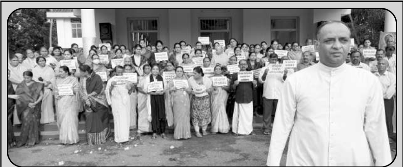
മണിപ്പൂർ ജനതയ്ക്ക് ഐക്യദാർഢ്യം പ്രഖ്യാപിച്ച് 2023 ജൂലൈ 2 ന് നടത്തിയ അയ്യന്തോൾ ഇടവകയുടെ പ്രതിഷേധം

മരണസമയത്തെ വിധിയിലൂടെ ഒരു വ്യക്തി ഒന്നുകിൽ സ്വർഗത്തിലോ, നരകത്തിലോ അല്ലെങ്കിൽ ശുദ്ധീകരണ സ്ഥലത്തിലോ എത്തിച്ചേരുന്നു. തനതു വിധിയിലൂടെയാണ് ദൈവം വിശുദ്ധർക്ക് സ്വർഗപ്രവേശനം നൽകിയിരിക്കുന്നത്. ഓരോരുത്തരുടെയും അന്ത്യവിധി തനതുവിധിയിൽനിന്ന് വ്യത്യസ്തമല്ല. അതുപോലെതന്നെ വിശുദ്ധരുടെയും, അന്ത്യവിധിയിൽ വിശുദ്ധരും ദൈവത്തോടൊത്ത് വാനമേഘങ്ങളിൽ ആഗതരാകും. വിശുദ്ധരെ സംബന്ധിച്ചിടത്തോളം തനതുവിധിയിൽ നിന്നും പൊതുവിധിയിലുള്ള വ്യത്യാസങ്ങൾ രണ്ടാണ്. എന്തുകൊണ്ട് ദൈവം അവർക്ക് സ്വർഗം കൊടുത്തു എന്നതും, അവരുടെ ജീവിതത്തിന്റെ മുഴുവൻ നന്മയും സകല സൃഷ്ടികൾക്കും മുമ്പിൽ വെളിപ്പെടുത്തുകയും, ആ വിശുദ്ധ പദവിക്ക് അവർ സർവമായോഗ്യരാണെന്ന് ലോകത്തിന് ബോധ്യപ്പെടുത്തുകയും ചെയ്യുന്നു. രണ്ടാമതായുള്ള വ്യത്യാസമെന്നു പറയുന്നത് വിശുദ്ധരുടെ ആത്മാക്കളാണ് അതുവരെയും സ്വർഗത്തിൽ നിത്യദാഗ്ധ്യം അനുഭവിച്ചുകൊണ്ടിരിക്കുന്നത്. അന്ത്യവിധിയുടെ സമയത്ത് മറ്റൊരാളുമനുഷ്ഠിക്കുകയും ശരീരങ്ങൾ ഉയിർക്കുന്നതോടൊപ്പം ഈ വിശുദ്ധരുടെയും ശരീരങ്ങൾ ഉയിർക്കുകയും, അവ മഹത്വീകരിക്കപ്പെട്ട അവസ്ഥയിൽ സ്വർഗദാഗ്ധ്യം അനുഭവിക്കുന്ന ആത്മാവുമായി കൂടിച്ചേരുകയും അങ്ങനെ, മനുഷ്യത്വത്തിന്റെ സമഗ്രതയിൽ അവർ സ്വർഗദാഗ്ധ്യം അനുഭവിച്ചു തുടങ്ങുകയും ചെയ്യുന്നു. ഇതാണ് അന്ത്യവിധിയിലൂടെ സംഭവിക്കുന്ന യഥാർത്ഥമായ മാറ്റം.